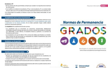
Figura 1. Normas de permanencia

3. Reunión evaluativa final (una cada trimestre, una semana después de los exámenes) en la que se reflexiona sobre lo aprendido y las posibles mejoras a implementar.